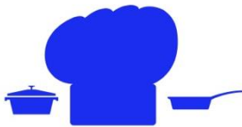
Curso de cocina